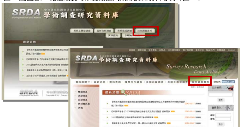
圖一、SRDA 形象首頁（上）及內頁（下）

從 SRDA 的形象首頁或內頁，很快可以找到「政府調查資料」的入口（如圖一框選處），點選後就可以直接進入政府調查資料專頁（圖二）。