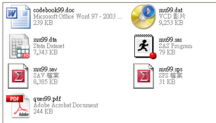
圖十、政府調查釋出檔案列表

SRDA 釋出的政府資料，大多提供多樣性的資料檔格式，除了 ASCII 搭配 SPSS 或 SAS 欄位定義程式外，壓縮檔中亦包括 SPSS、STATA 等統計軟體系統檔，申請人可以依照使用習慣選擇，建議個人電腦設定顯示檔案的副檔名，以利檔案的識別。圖十為主計處人力運用調查 2010 年釋出之檔案列表，共包括 9 個檔案：