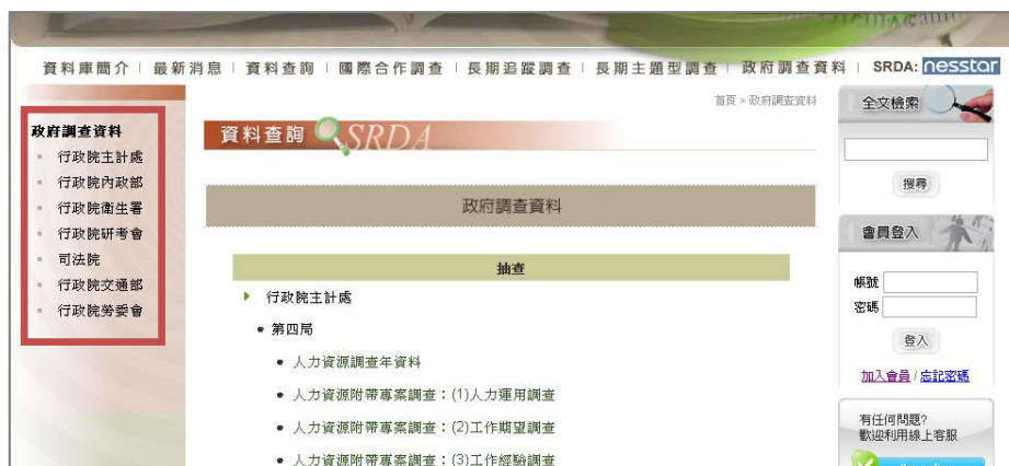
圖二、政府調查資料專頁