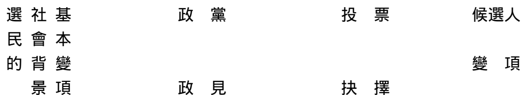
圖二 2 選民投票傾向的主要來源

對於較有定論的行為變項，我們擬以之為基本理論模式的單位。政黨、政見、及候選人三者，我們仍認為是影響選民投票行為的主要來源。以圖二 2 示之：